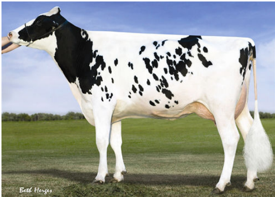
VISION-GEN SH SHO A12037 FOURTH DAM