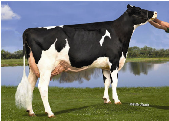
KY-BLUE GW DANA FIFTH DAM